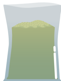
Sacos de revestimentos genéricos